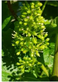
Primi fiori su Pinot grigio

È rinnovato l'invito ad integrare il trattamento con prodotti a base di microelementi e si invita caldamente ad apportare alla varietà Glera ed alle varietà sensibili al fenomeno di acclatatura prodotti a base di Boro.